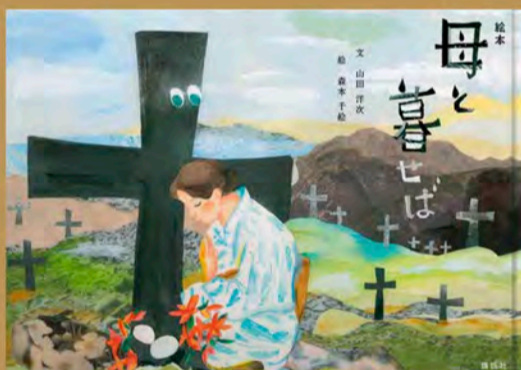
「絵本 母と暮せば」文・山田洋次 絵・森本千絵 講談社/定価1800円税別