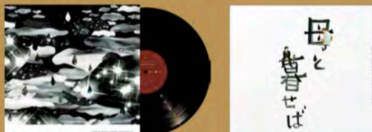
オリジナル・サウンドトラック「母と暮せば」/坂本龍一 (左:LP Record、右:CD)