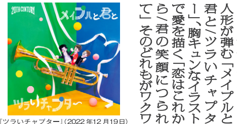
「ツライイチャプター」(2022年12月19日)

代に、いつまでも変わらない『親子』を描く映画『こんにちは、母さん』が完成しました。goen°は「男はつらいよお帰り寅さん」(2019)、『キネマの神様』(2021)に続きポスターデザインを担当する。9月1日公開。