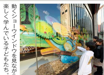
動くショーウィンドウを見ながら楽しく学んでいる子どもたち