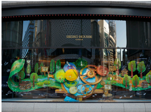
「時の森」は、2023年1月26日から2月22日まで SEIKO HOUSE GINZA のショーウィンドウを飾った。