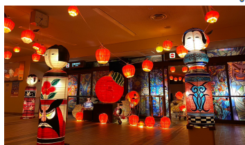
三沢空港「リング提灯ジャック」