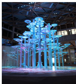
八戸マチニワ「水の樹」